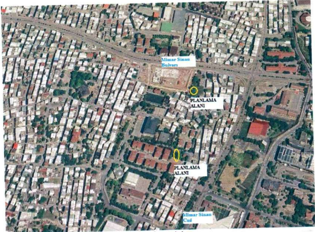
Şekil 1: Planlama alanı

Alan ilçe merkezinin 3200 m doğusunda, Mimar Sinan Bulvarının 90 m ve 270 m güneyinde, Mimar Sinan Caddesinin 150 m batısında yer almaktadır.